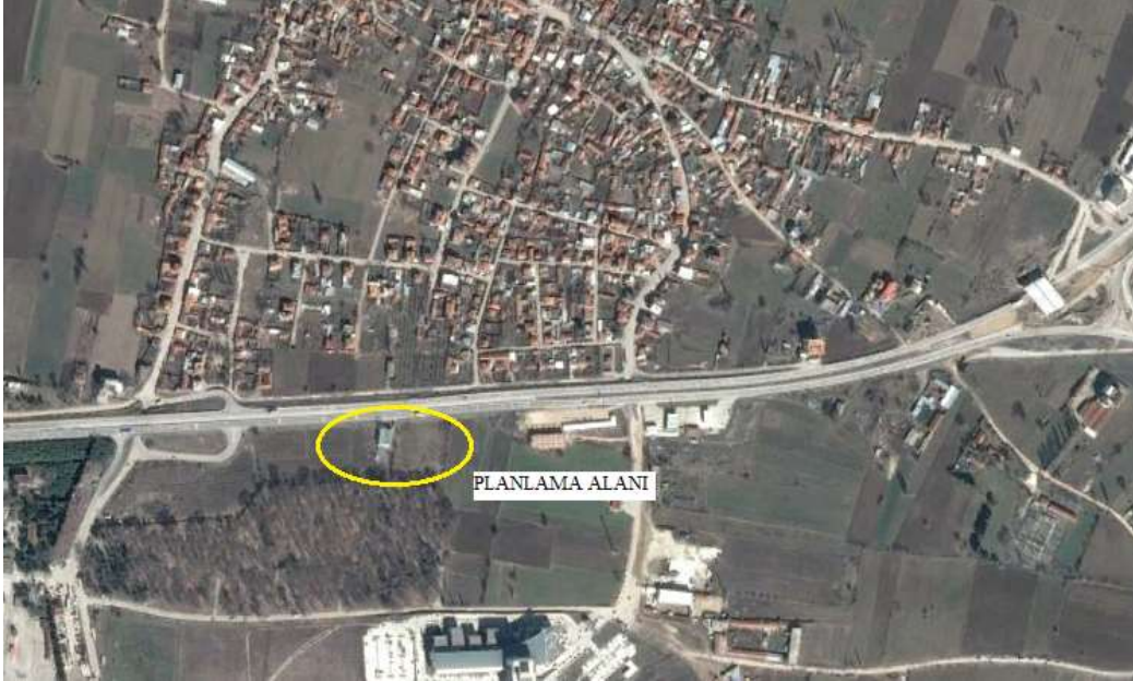
Planlama alanı

Alanın eğimi %5'in altında olup düz bir topografyaya sahiptir. Parseller halihazırda boş olup üzerlerinde yapı bulunmamaktadır.